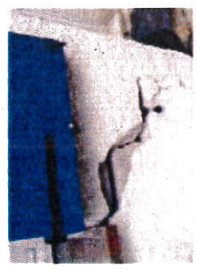
Exemple : Fissurations dues à la sécheresse